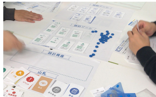
図1. ゲームプレイの様子

VUCA などのキーワードで表現されるように複雑性や変動性が高い現代のビジネス環境では、従来の意思決定や組織のあり方が通用せず大きな変化が必要となっている[1]。プロダクトやサービスのデザインについても同様であり、複雑性に対する整合性検証と変動性に対する価値検証の両立を実現できるような、新しい考え方やプロセスが求められている。発表者らのグループはシステムデザインという観点から、そのようなビジネス環境におけるプロダクトやサービスの設計開発において必要な考え方やプロセスについて整理し、普及する活動に取り組んでいる[2]。その一環として、プロダクトやサービスの開発において複雑性や変動性がどのような問題を起こすのかを理解し、それに対してどのようなシステムデザインが必要なのかについて考えることのできるゲーム教材を開発した。開発したゲームは、大学における工学教育や、企業における人材育成などの機会において導入教材として用いることができ、プレイ後のデブリーフィングや関連する内容を扱うワークショップなどと組み合わせることで、効果的な学びを生み出すことが期待できる。開発したゲームがプレイされている様子を図1に示す。